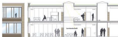
Detail Fassade / Schnitt

Die neue lediglich III-geschossige Gebäudestruktur reagiert einfühlsam auf die Umgebung. Das gesamte Erscheinungsbild des BBZ wird durch den maßvollen und klar gegliederten Neubau wohlthuend beruhigt. Großzügige Hofbildungen erzeugen natürliche Belichtung, Transparenz und Aufenthaltsqualität. Hohe Flexibilität durch die Ausbildung von überschaubaren und unterschiedlich nutzbaren Clustern. Schaffung von zusätzlichen Arbeits- und Kommunikationszonen durch II-geschossige Lichtgalerien im Clusterzentrum.