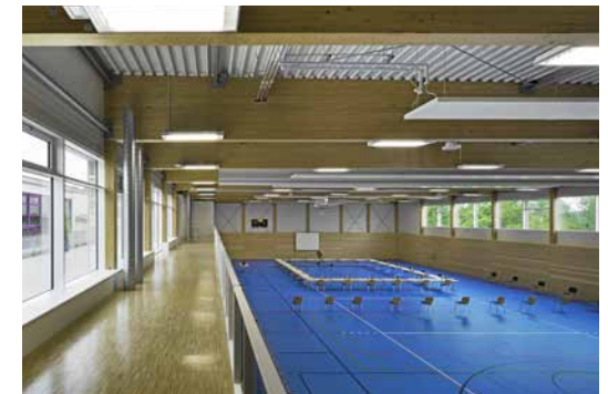
Galerie und Spielfläche

Die zweite Sporthalle präsentiert sich als kompakter Baukörper neben der heterogenen Ausbildung der bestehenden Altenbürghalle. Die reduzierte Formensprache und die Metall-Panel-Fassade schafft eine angenehme Unterscheidung zwischen Alt- und Neu. Eine neue Terrasse mit direktem Zugang zu der Galerie des Neubaus und den Zuschauertribünen der bestehenden Gebäudes verbindet die beiden Sporthallen.